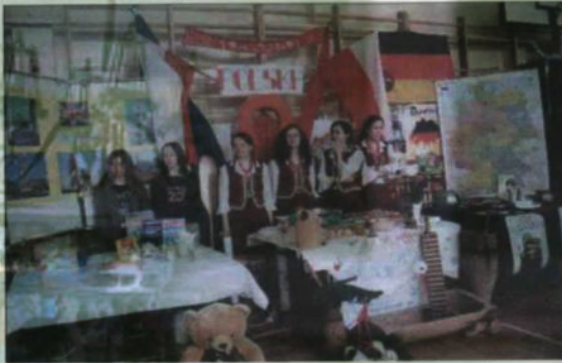
Dawało to niepowtarzalną możliwość

Inną okolicznością integracji europejskiej były liczne i wielokierunkowe kontakty krajowe i międzynarodowe. IX LO współpracowało z organizacjami w europejskich programach edukacyjnych dokonując międzynarodowych wymian młodzieży i kadry pedagogicznej ze szkołami w Szwajcarii, Holandii, Austrii, Włoch i Hiszpanii.