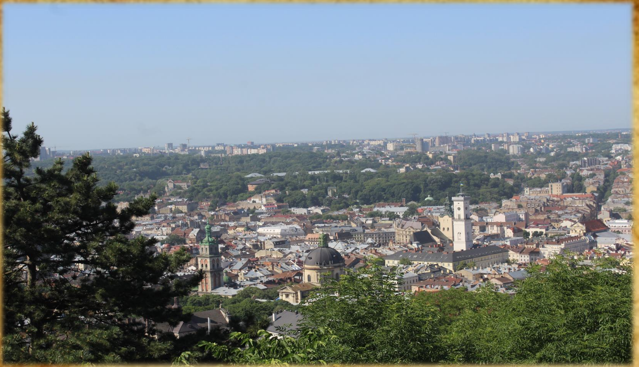
Widok na panoramę Lwowa