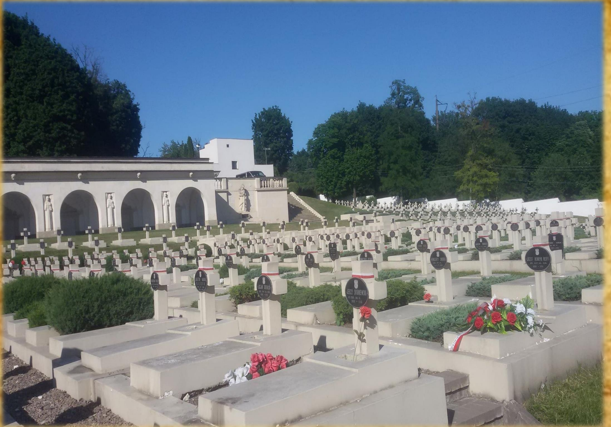
Mogiły poległych w walkach